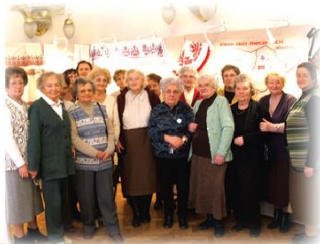
Aranygyűszű Diszítóművészeti Kör

A nagymúltú csoportok mellett a kor igényeit követve érdeklődési körük szerint újabb és újabb közösségek szerveződnek (Pl. Lajos Árpád Honismereti Kör, Modellező Kör). A közös együttlétek során fejlődnek a tagok egyéni készségei és képességei. A sokszor igazán kimagasló sikerek nemcsak összekovácsolják a közösséget, hanem városunk, Ózd számára is dicsőséget hoznak.