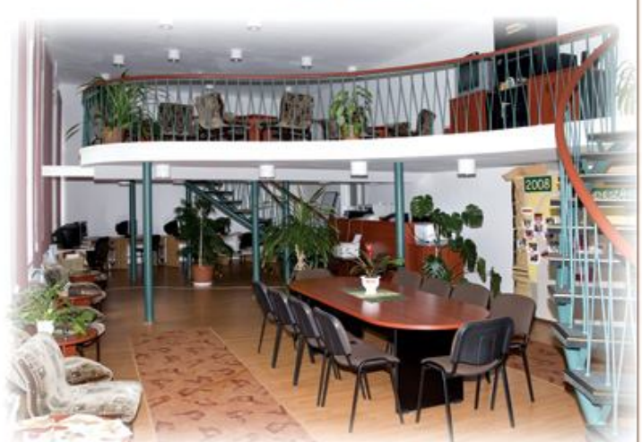
Közkedvelt közösségi színtér a KulcsPont

Őrizzük és ápoljuk hagyományainkat, folyamatosan keressük a megújulás lehetőségeit. A földszinti Zeneterem, Mozgásművészeti Stúdió, Civil sarok, KulcsPont teljes körűen szolgálja a művészeti csoportokat, közösségeket, az oktatást, tehetséggondozást. Az emeleti Táncterem, Protokoll terem, foyer a zenés-táncos rendezvények, tanácskozások, képzések, konferenciák, pódium műsorok méltó helyszíne. A Kisgaléria időszaki tárlatai sokszínűek.