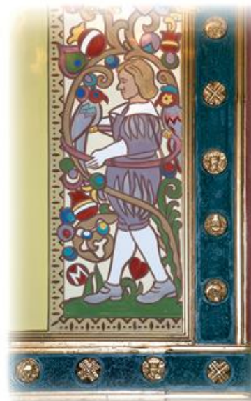
Népies szecessziós stílusú díszítőfestés, 2007

A közel 700 fő befogadására alkalmas Színházterem a professzionális színházi előadások mellett műkedvelő, díszletes színházi produkcióknak, komolyzenei hangversenyeknek, konferenciáknak, gálaműsoroknak, fesztiváloknak, Ózd és térsége ünnepi eseményeinek is otthont ad.