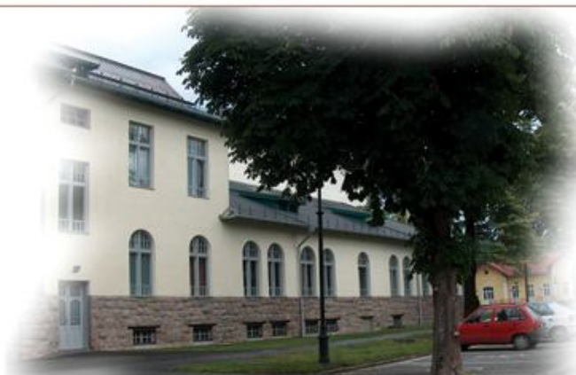
A térség kulturális központjának oldalbejárata