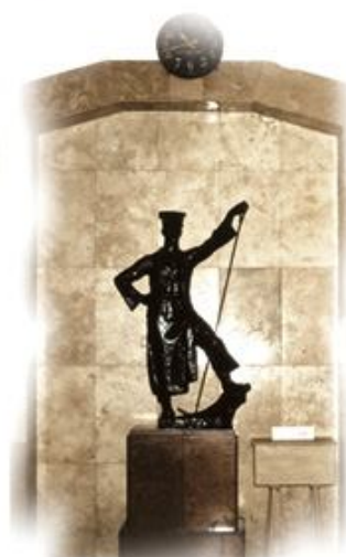
Somogyi József Martinász (1953) című szobra a földszinti előtérben, 1981