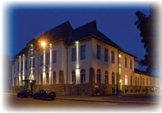
Az Olvasó épület esti fényei, 2008

A kohászat felszámolása, az Olvasó Egyesület 1999-ben történt megszűnése után a 7 évig üresen álló, erőteljesen leromlott állapotú épület felújítása Ózd Város Önkormányzatának pénzügyi forrásaival és a kormány címzett támogatásával 2007-re fejeződött be. A 2005-ben műemléki jegyzékbe vett ház 2007. október 23-án nyitotta meg kapuit.