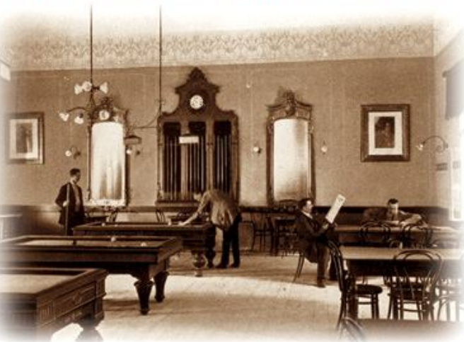
A régi Olvasó épület Játékkerme, 1913

1907-ben az Olvasó Egylet taglétszáma már 600 fő fölött volt, s bár a régi épületet bővítették és felújították, az már szűkösnek bizonyult. A jelenleg is működő Olvasó Egylet-i székház építése 1923-ban vette kezdetét.