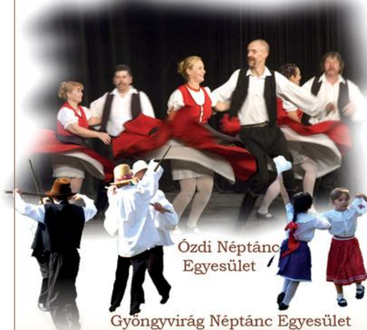
Ózdi Néptánc Egyesület