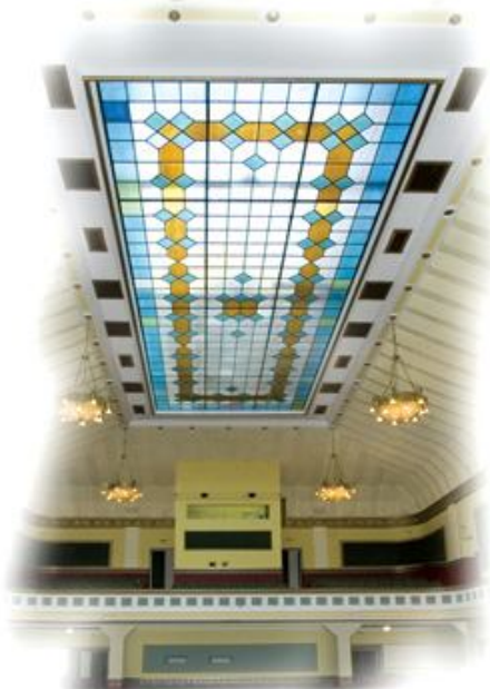
A kazettás, színes, egyedi üvegmennevezet