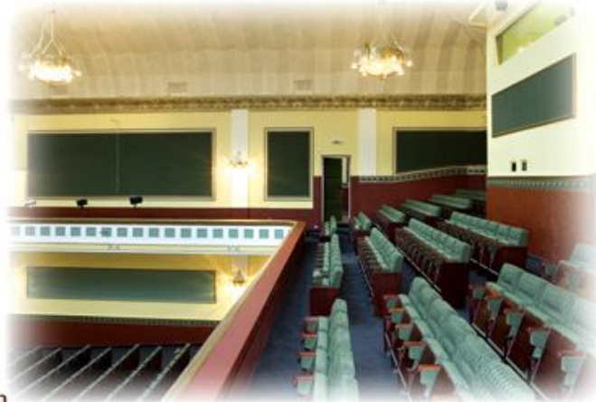
A kazettás, tagolt erkélymellvéd részlete