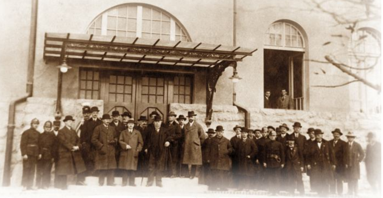
125 ÉVES AZ ÓZDI GYÁRI OLVASÓ EGYLET