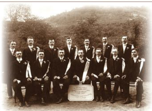
A Gyári Olvasó Egylet 25 éves jubileumi emlékünnepség rendező bizottsága, 1909