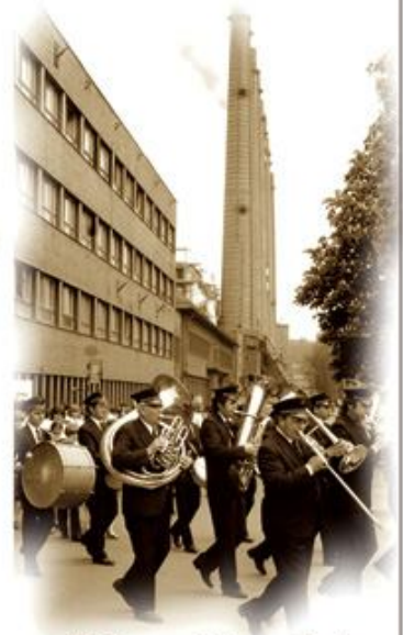
Felvonulás a Gyár úton, 1978