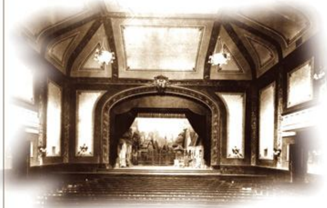
Levezőlap a színházteremmel, 1929