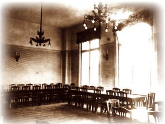
A Tanácsterem 1907 előtt