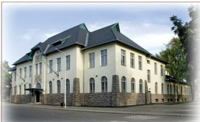
Az "Olvasó" a 2007-es rekonstrukciót követően az Ózdi Művelődési Intézmények székhelye