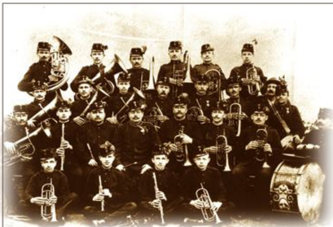
A gyári zenekar, 1898