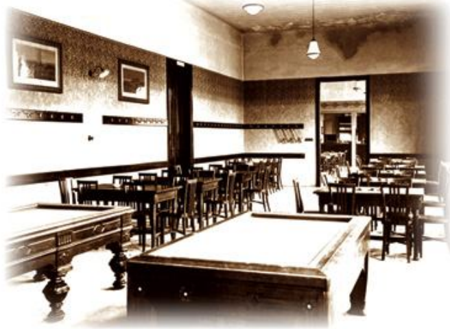
A régi Olvasó épület Játékkerme, 1907 előtt