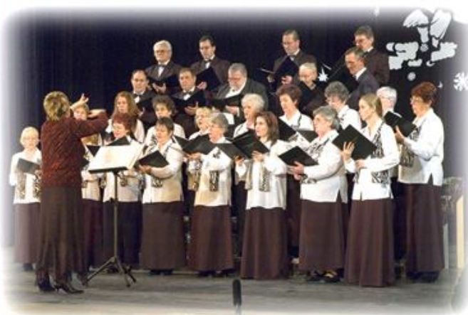
Ózdi Városi Vegyeskar