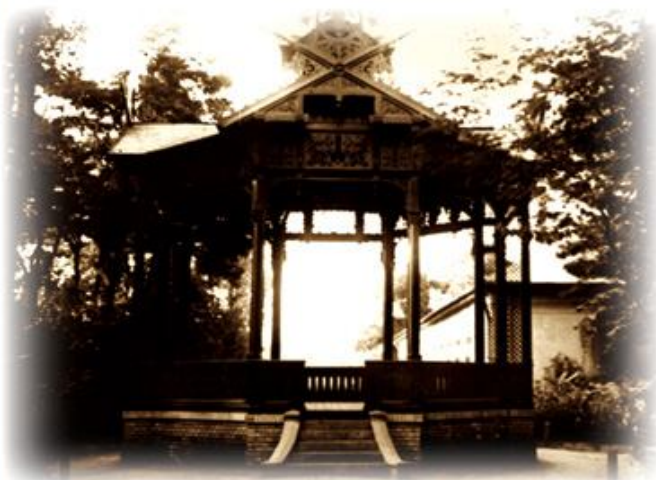
Zenepavilon az Olvasó parkjában, kb. 1905