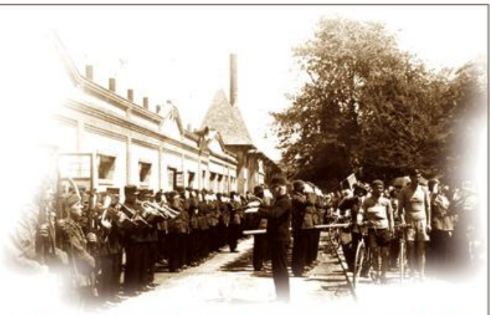
A fúvószenekar a gyári főkapunál, kb. 1935