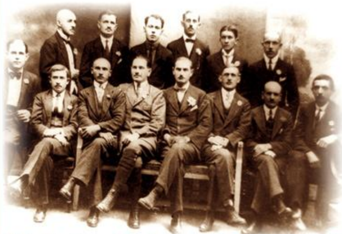
A Gyári Olvasó Egylet vigalmi bizottsága, 1920