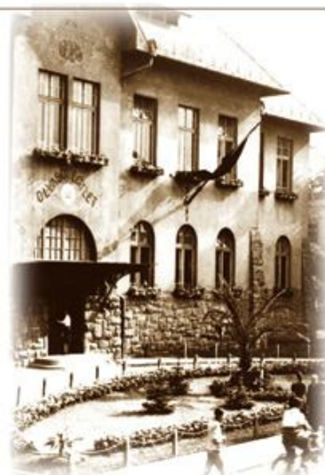
A székház homlokzata a bejárat előtti parkkal, kb. 1935