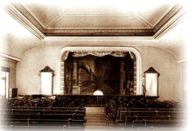
A régi Olvasó épület Táncterme a színpaddal, 1913