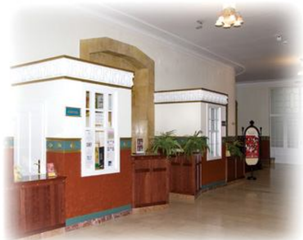
Az eredeti állapotában visszaállított információ és jegypénztár