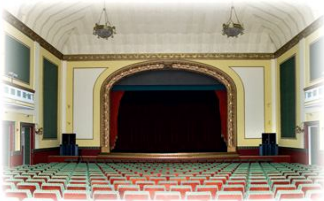
A közönség- csalogató impozáns Színházterem