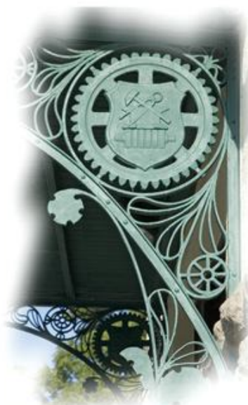
Kovácsoltvas díszítés a bejárati elötető tartószerkezetén