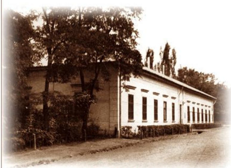
A Gyári Olvasó Egylet első épülete