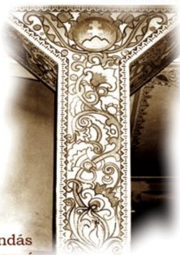
A falpillérek figurális és növényi indás díszítőfestése Marschalkó Béla tervezése