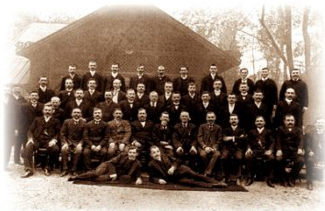
A Gyári Olvasó Egylet tagjai, 1913

1881-ben vetődött fel a gondolat, hogy a Rimamurány-Salgótarjáni Vasmű Rt. ózdi telepén a gyári munkások megfelelő helyiséggel egyesületet alapítsanak, mely otthona lenne a kulturált időtöltésnek. 1884. november 14-én így alakult meg a Rimamurány-Salgótarjáni Vasmű Részvénytársaság Ózdi Felvigyázó- és Munkásszemélyzet Olvasó Egylete.