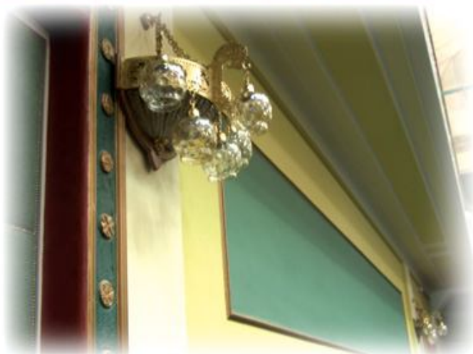
A Színháztermet is díszes csillárok és falikarok ékesítik