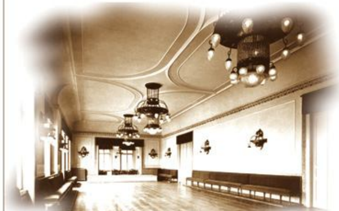
A táncterem, 1924