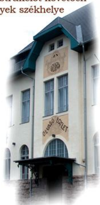
Az épület homlokzata