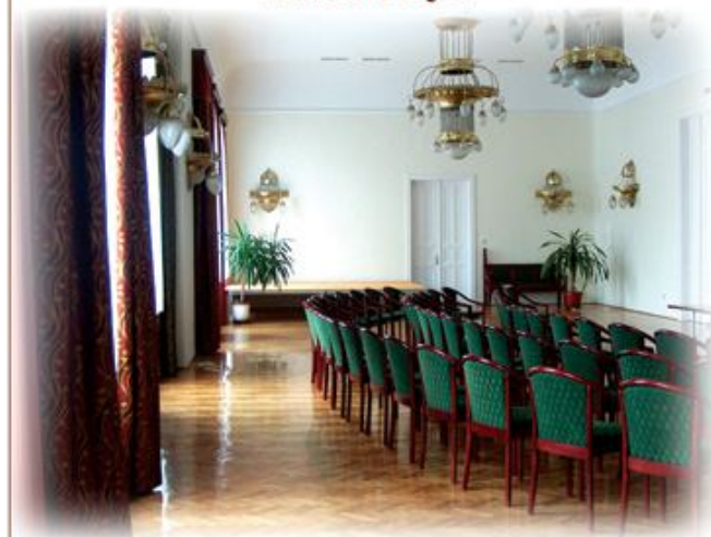
A ma már több funkciót betöltő Táncterem