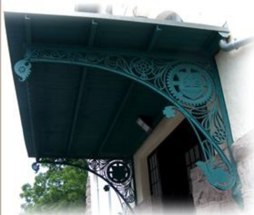
A bejárati elötető