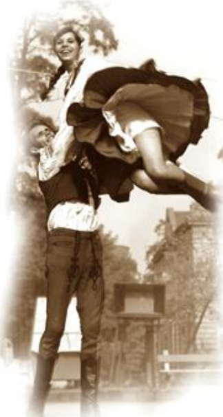
Kohász Táncegyüttes, 1972