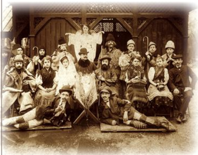
A Színjátszókör karácsonyi témájú előadásának szereplői az Olvasó parkjában, 1900 körül