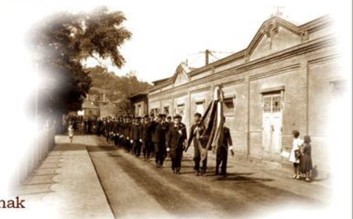
A Dalárda felvonulása a Gyár úton, 1948

Az egyleten belül mindig nagy hangsúlyt kapott a dolgozók olvasási igényének kielégítése és a munkások köréből alakult öntevékeny művészeti csoportokban a magas, művészi szintű munka biztosítása. Kezdetől fogva működött a könyvtár, melyet folyamatosan fejlesztettek, 1895-ben megalakult a fúvószenekar, 1896-ban a színjátszó csoport, 1897-ben a dalárda, majd ezt követően a néptánc csoport.