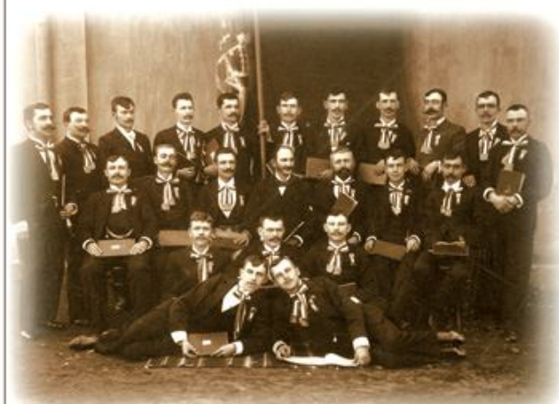
Olvasó Egyleti Dalárda, 1898. Március 15.