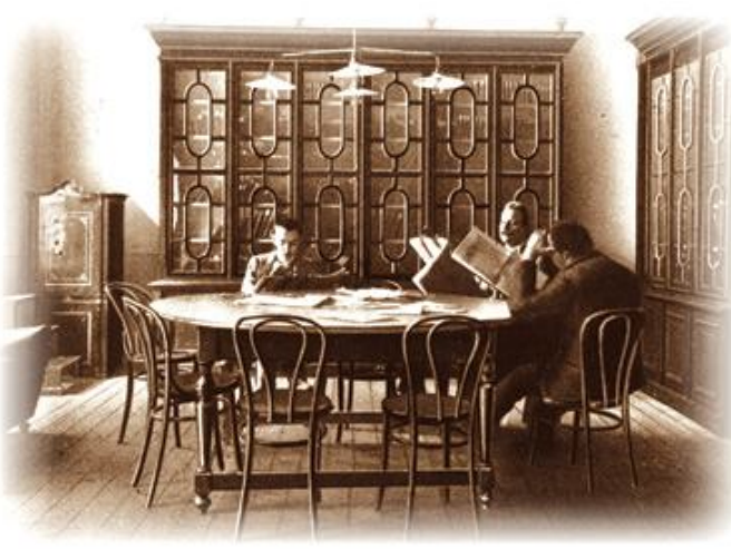
A régi Olvasó épület Könyvtárterme, 1913