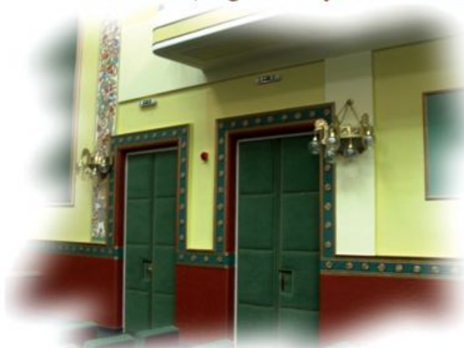
A Színházterem bejárati ajtói