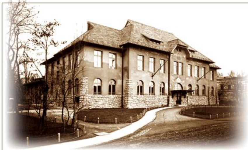
Az 1924-ben átadott, szecessziós stílusú épület