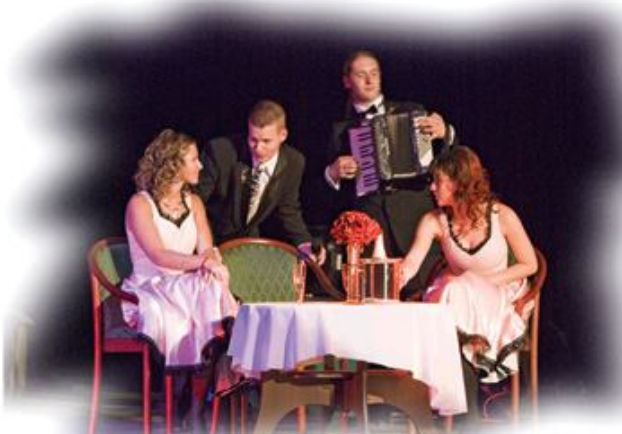
ÓMI Zenés Színház