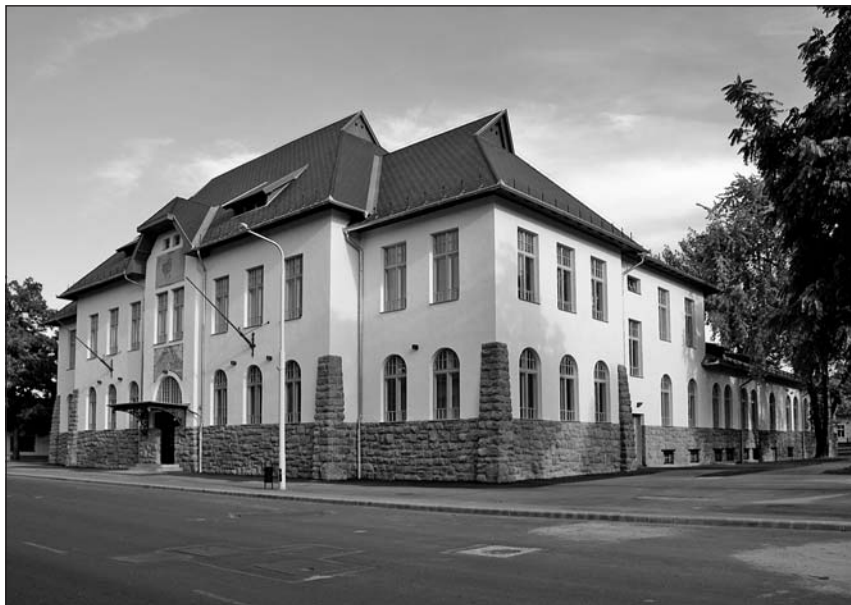
A felújított Olvasó látképe

2006. őszén a Városi Művelődési Központ az Olvasó kezelő szerveként adta át az épületet, mint munkaterületet a kivitelezés jogát elnyert FK Raszter Építő Zrt. részére. Lebonyolító céggént az Archinvest 97 Kft. közreműködött.