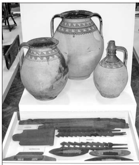
Gömöri edények, és a szövés néhány eszköze

Kultúrtörténeti érdekességnek számít, hogy az egykoron kiemelkedő infrastruktúrával rendelkező Farkaslyuk egy saját cserépedényüzemmel is rendelkezett. Attól függetlenül, hogy az itt előállított termékek minőségileg nem vehették fel a versenyt a nagy gyárakkal, jelentősnek volt mondható a kereslet irántuk. Mindemellet az önellátást is prezentálja, hogy a szénbányászat egyik „mellékterméke” lett ez a bizonyos, súlyáról és barna mázas, többnyire kék, zöld virágmintás sablonfestésű, cserépedény amely a kiállításon látható. Az üzem a hét egy nap-