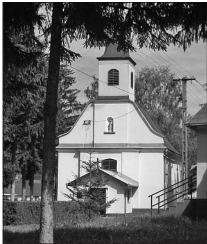
A domaházi római katolikus templom