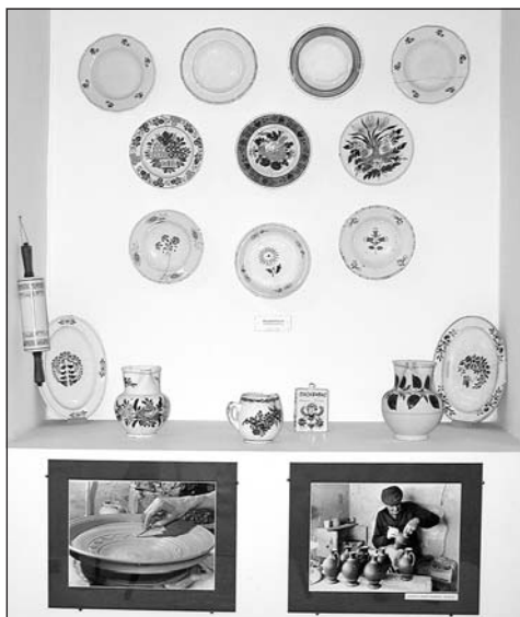
Cserépedények, és a dereski fazekasmesterről készült fotók

nem sikerült még a múzeum számára megszerezni. Hozzá tartozott a hasonló edényeken kívül a fedél, illetve az azokat összekötő szalag. A fülén barna, raffozásos díszítés található. A porzókon ívelt vonalkázás, a levél erezete árnyaltabb, mint a többi kompozíciós részleten. Szintén bélapátfalvi az a pálinkás butella, amelynél a talprész megfogalmazása barokkos jegyeket visel magán. Aszimmetrikus virágkompozíció jellemzi, realisztikus a levél és a védjegyek számító pour-pour rózsza kialakítása. A szóban forgó stílushoz nagyon hasonló a következő, hollóházi gyárban készült darab, azonban, ha tüzetesebben megvizsgáljuk eltéréseket tapasztalhatunk. Három sablonos, csonka „máltai” szegfű van a peremén.