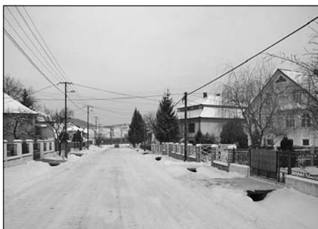
Borsodszentgyörgy - téli utcarészlet

Csepányon az adatok tanúsága szerint az iparforgalom mértéke 30 év alatt ugyancsak megduplázódott. Miközben a bányászatban és kohászatban dolgozók mellett az egyéb ipari tevékenységeket folytatók számában is jelentős változás történt: a keresők aránya 85%-kal, az eltartottaké több mint 140%-kal emelkedett Hódoscsépányon 1900 és 1930 között. A községhez tartozó Somsálybányán az iparban dolgozók aránya még magasabb volt. 38 Az iparosodás folytatását jelzi, hogy a század közepére az iparban és bányászatban dolgozók aránya a faluban elérte a 80%-ot: 1949-ben 2528 fő tevékenykedett ebben a gazdasági szektorban, amely az összlakosság (3147 fő) döntő többségét jelentette. 39 Ennek megfelelően szükséges külön elvégezni ezen társadalmi réteg tagolását, hiszen számuk a későbbiekben további emelkedést mutat. Kósa László szerint az egyik legfontosabb lépés a munkások és az alkalmazottak elkülönítése. Hódoscsépányon már az előbbiek aránya a domináns: a szektoron belül 92%-ot, a lakosság foglalkozási megoszlást nézve pedig 74%-ot képviseltek a keresőket és eltartottakat is beleértve. A gyarapodás országos szinten 1970-ig folytatódott az állami ipar és építőipar területén: az ipari munkások száma közel két és félszeresére nőtt, miközben az egy munkásra jutó alkalmazottak aránya szintén jelentős mértékben emelkedett