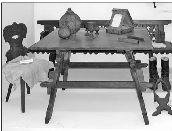
Ács munkák, faragások

Mivel egykoron jelentős volt a fafeldolgozás vidékünkön, az ácsolt bútorok használata is nagy számban fordult elő. Ennek köszönhetően került egy-egy jellegzetes darab a múzeumba is. Ilyen az az ácsolt asztal, amelyenél szögek nélkül csapolással rögzítették a különböző részeket. Szemrevaló a díszesen faragott háttámlájú, kissé rokokós „paraszt-szék” is, ami szintén