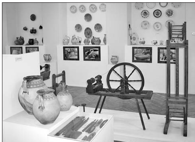
Részlet a cserépedényeket és a kenderfeldolgozás eszközeit bemutató kiállításból

falusi emberek használták. A harmadik pedig a Faggyas István gyűjtemény részét képező- elsősorban a pásztorkodással, állattartással összefüggő darabok megtekintésével zárul.