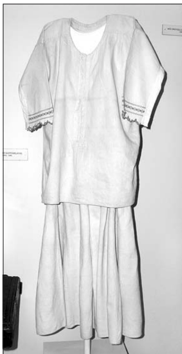
Női ingváll és szoknya Ományból

szokás használni. Jellegzetes textil még a hamvas, amely tulajdonképpen egy hordeszköz. Múzeumokban ritkán látni a középső teremben elhelyezett halottas terítőt, amely ízlésesen hímzett, nagy méretével vonzza a belépő tekintetét.