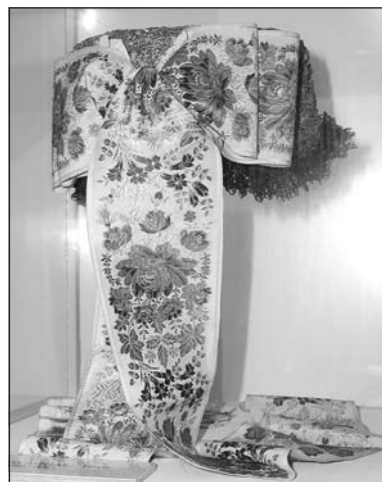
Sík aranyos párta

A mindennapi használatra szánt vászon- nak az ún. vert csík volt az egyetlen éke. Jó- val tartósabb volt, mint a hímzett, vagy akár a felszedett díszítés. Ilyen vertcsíkosak vol- tak a szakajtkendők, vagy a tárlókban meg-