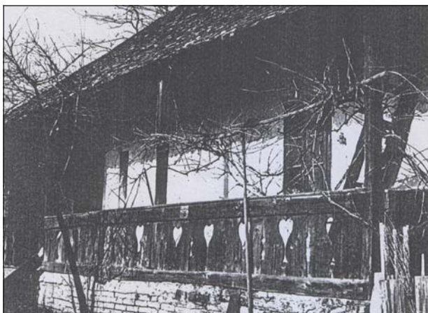
1880 táján épült tornácos lakóház. Ózd-Hódoscsépány, 1985

A negyedik sajátos jegy a házassági kapcsolatokra vonatkozik, ahol nemesi és vallási endogámia érvényesült. Utóbbin belül a dominanciát mutatja, hogy mindhárom településen a római katolikusok aránya még 2001-ben is 90% feletti volt, azt megelőzően pedig még magasabb arányt láthatunk a népszámlálási kötetekben. Borsodszentgyörgyön például