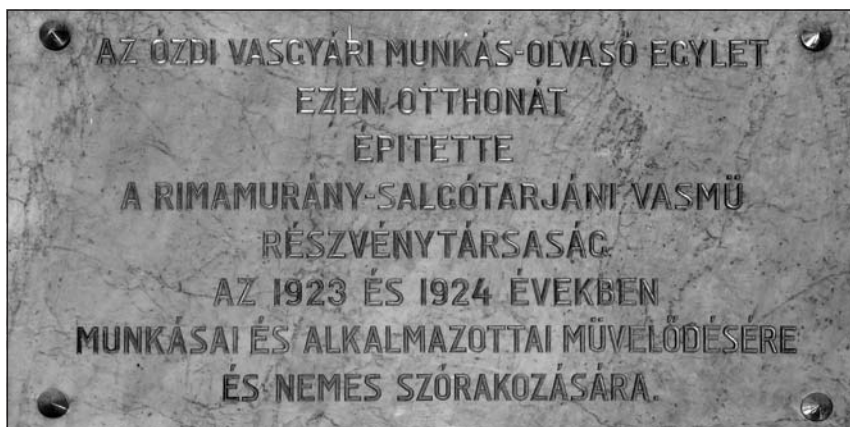
Márványtábla az Olvasó falán