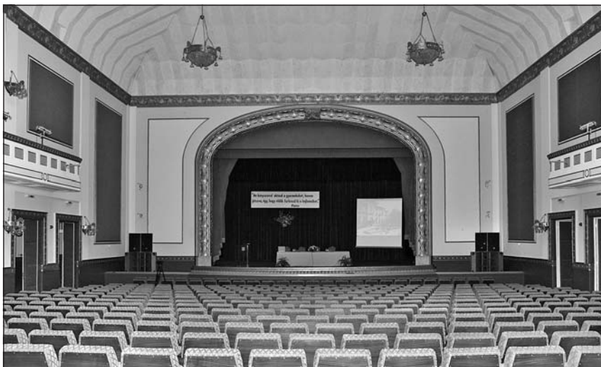
Az Olvasó színházterme

Ugyanakkor a szép menyasszony az irodákban sem kaphatta meg a korábbi helyünkön használt, s meglehetősen elhasználódott, kopott bútorzatot.