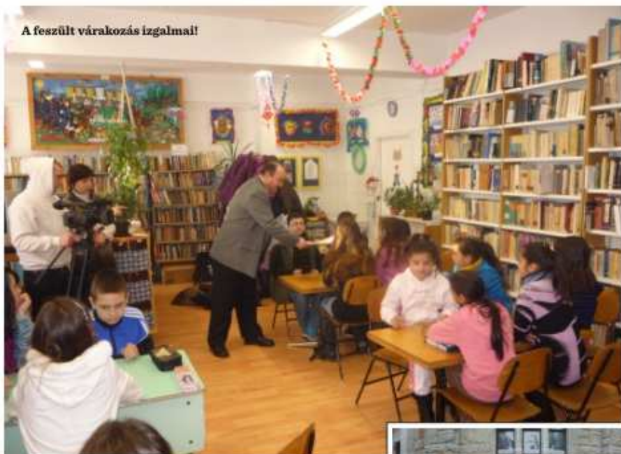
A feszült várakozás izgalma!