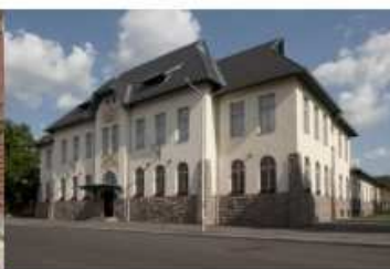
ICOMOS díjjal kitüntetett Ózdi Művelődési Intézmények "Olvasó"