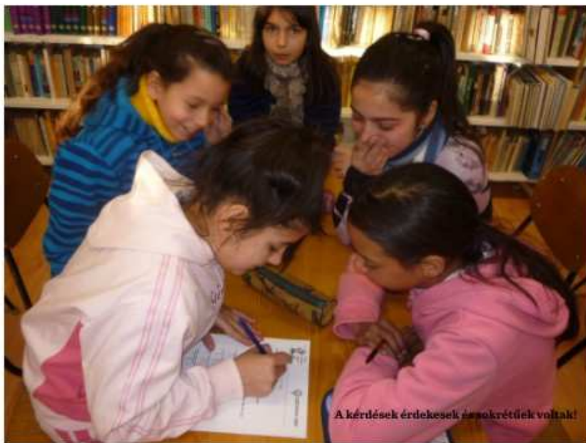
A kérdések érdekesek és sokrétűek voltak!

A vetélkedők közül 2-2 forduló a résztvevők iskoláiban zajlott, míg a harmadik összecsapásra az "Olvasó" Táncteremben került sor mindhárom iskola esetében. A szellemi tusát egy különleges kulcspon-party zárta le, melyben a gyerekek örömmel vették birtokukba a csocsót, vagy a ping-pong asztalt, míg a bátrabbak egy karaoke összecsapásban próbálhatták ki énektudásukat.