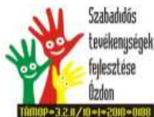
A kezeknél csak az arcok boldogabbak!

működő pedagógus és partnerintézmény vezető szerint a támogatásnak köszönhetően kapott új lendületet a délutáni szakköri mozgalom, és jóleső örömmel nyugtázták, hogy azok a diákok is, akik a tanórákon kevésbé aktívak, milyen energiával vesznek részt például a játék, a színjátszó vagy mondjuk a társastánc, netán néptánc szakkörökön - ahol szinte láthatatlanul fejlődik személyiségük -, illetve bontakoztatják ki kreativitásukat a képzőművészeti szakkörökön, és fejlesztik tehetségüket a nyelvi vagy a kémiaszakkörökön.