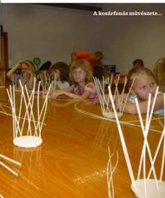
A kosárfonás művészete...