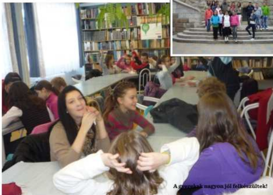
A gyerekek nagyon jól felkészültek!