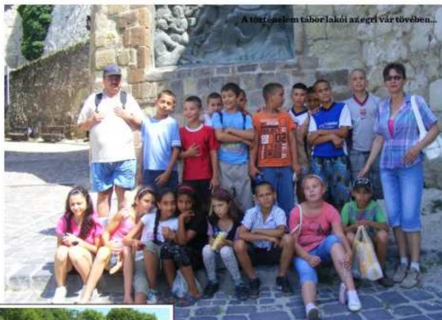
A történelem tábor lakói az egeri vár tövében...