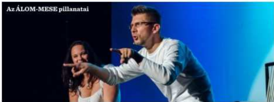
Az ÁLOM-MESE pillanatai

három órás gálaműsorral, melyben bemutatkoztak a II. János Pál Katolikus Általános Iskola kórus és néptánc szakkörei, a Bánréve ÁMK néptánc és színjátszó szakkörei, a Bolyky Tamás Általános Iskola néptánc szakköre, a Béke Telepi Óvodák német, zeneovi és torna szakkörei, az Újváros Térségi Általános Iskola bábszínjátszó, színjátszó, társastánc és néptánc szakkörei valamint a Vasvár Úti Általános Iskola színjátszó szakkörei. A mintegy 400 diák előtt zajló jó hangulatú gálaműsort a Rémkoppanyók és Vokálcicák Álom-Mese produkciója koronázta meg.