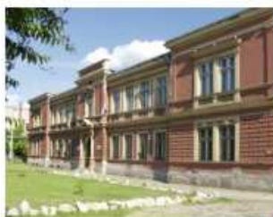
ÓMI Városi Múzeum