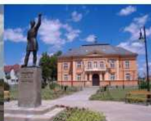
ÓMI Városi Könyvtár