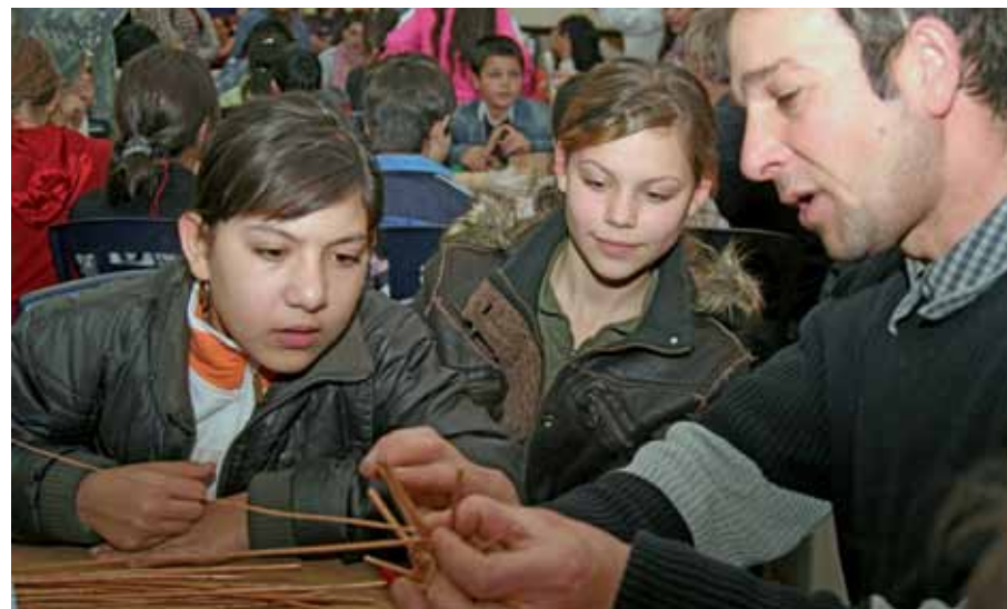
A nyitórendezvényen a gyerekek elsajátíthatták a kosárfonás alapjait

A pályázat során kidolgozott tematikák, tananyagok, illetve kutatások hozzáférhetőségével szeretnénk segíteni a pedagógusok, közművelődési szakemberek, valamint a szélesebb érdeklődő közönség munkáját. Természetesen lehetőséget nyújtunk arra, hogy bárki komolyabb betekintést nyerhessen a projekt munkába. Elérhetőek lesznek a rendezvényeken, képzéseken készült fényképek, szakmai és sajtó anyagok, valamint a pályázat teljes munkásságát bemutató összefoglaló vizuális dokumentációk is.