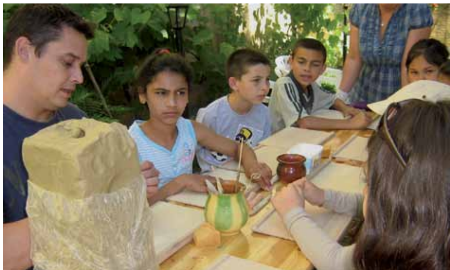
A fazekas mesterség bemutatása a Kézműves táborban