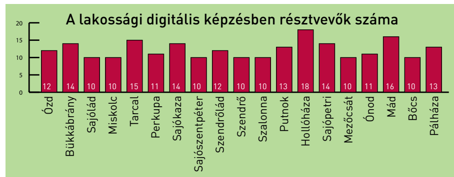
A lakossági digitális kompetenciafejlesztő tréning résztvevőinek száma település szerinti bontásban

Az alábbi diagram azt ábrázolja, hogy a megye mely településeit tudtuk bevonni