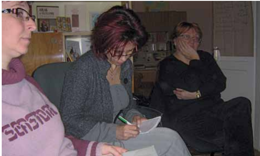
5 napos képzés keretében sajtóították el a pedagógusok az életvezetési ismeretek alapjait