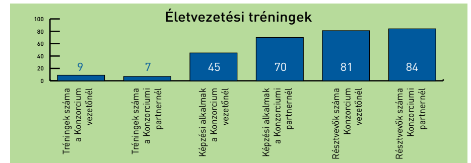
A konzorciumvezető és konzorciumi partner által megvalósított életvezetési tréningek indikátorszámai

problémái. Az említett programok eredményeként könnyelhető el többek között, hogy a foglalkozásokon lezajlott beszélgetések mozgósítani tudták a fiatalok belső erőforrásait, felkeltették érdeklődésüket a munkaerőpiacon történő elhelyezkedésre, továbbá motiválóan hatottak az általános interetnikus együttélési és társadalmi normák internalizálására.