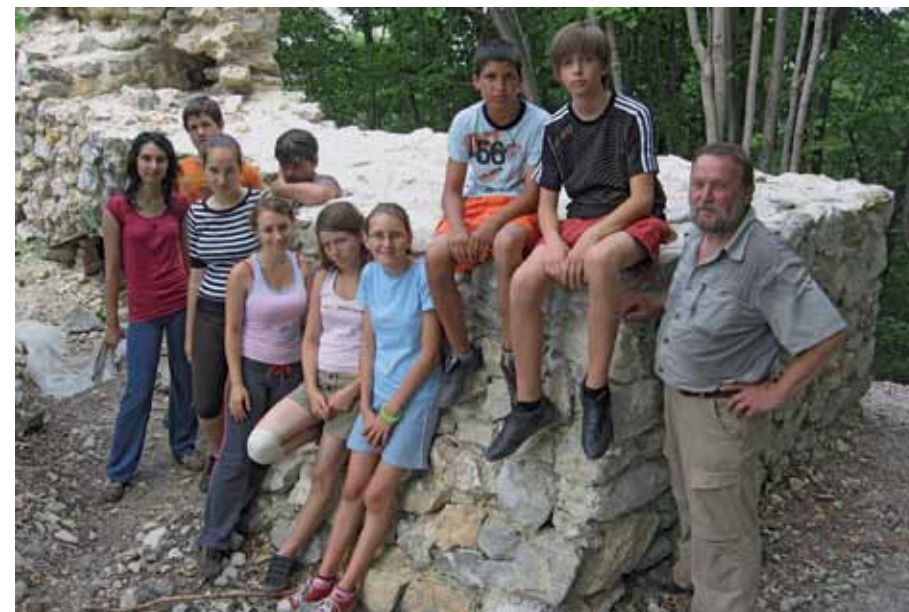
Helytörténeti tábor, Nagyvisnyó

Természetesen a képzés tematikájában a legfontosabb szerepet a múlt értékeire való fókuszálás töltötte be. A gyerekek az adott települések múltjával kapcsolatban információkat gyűjtöttek, riportokat ké-