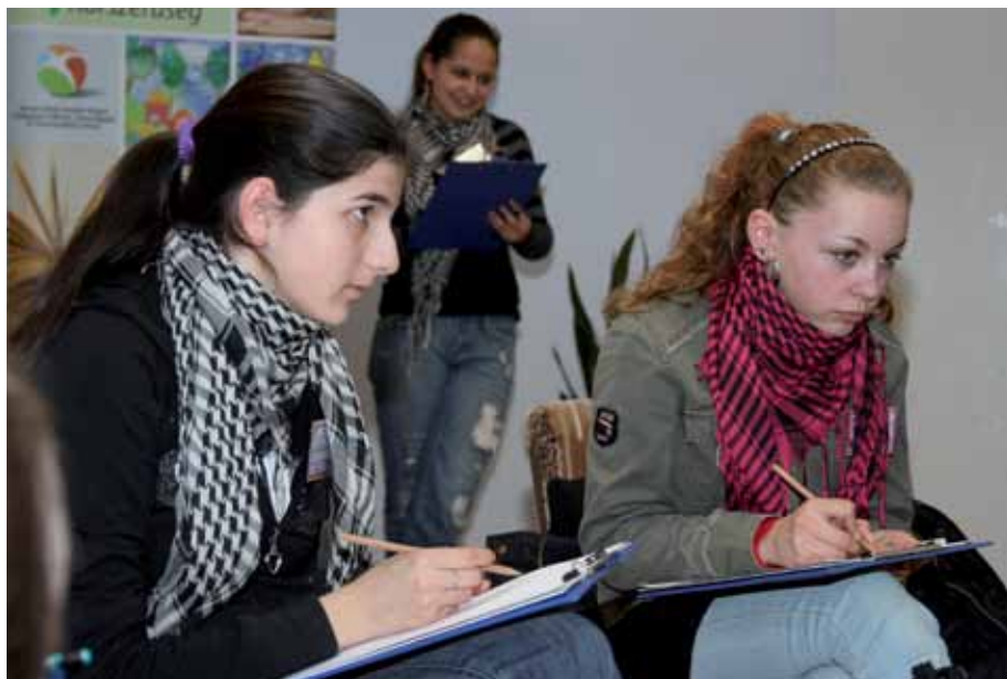
Életvezetési tréning, melynek fő célja a hátrányos helyzetű fiatalok kulcskompetenciáinak fejlesztése

Az országos és helyi szinten zajló törekvések közül néhány megpróbálja a közoktatás fent említett hiányosságait ellensúlyozni, ám a fiatalok személyiségének és képességeinek fejlesztése teljes körűen ezekkel a programokkal nem megoldott. Az ÓMI részéről egy már kipróbált, kiváló hatásfokú életvezetési tréning került adaptálásra, és továbbfejlesztésre. Mind az adaptálást, mind a továbbfejlesztés alapjait a célcsoport körében elvégzett igényfelmérés teremtette meg. Alapvető célként fogalmaztuk meg, hogy azok a gyermekek és fiatalok részesüljenek egyénre szabott fejlesztésben, akiknek erre korábban nem