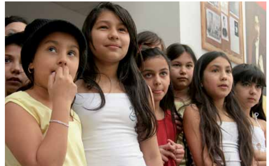
Szendrő: Tehetséges cigány fiatalok kulturális seregszemléje

Szendrőn, Tiszakarádon és Tiszaújvárosban sor került az intézmény szervezésében már hagyományosnak számító „Tehetség-