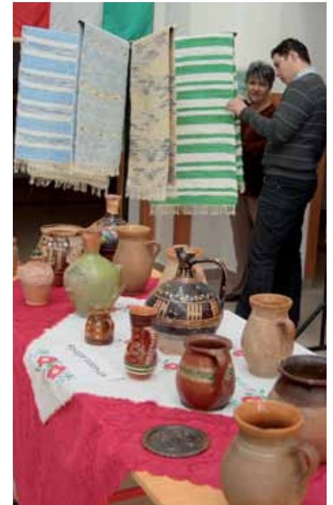
Roma hagyományokat, mestersegeket bemutató kiállítás Szendrőn

A projekten belüli közösségi programok, tevékenységek központi célja, hogy a helyi közösségek hagyományaira és az érintet-