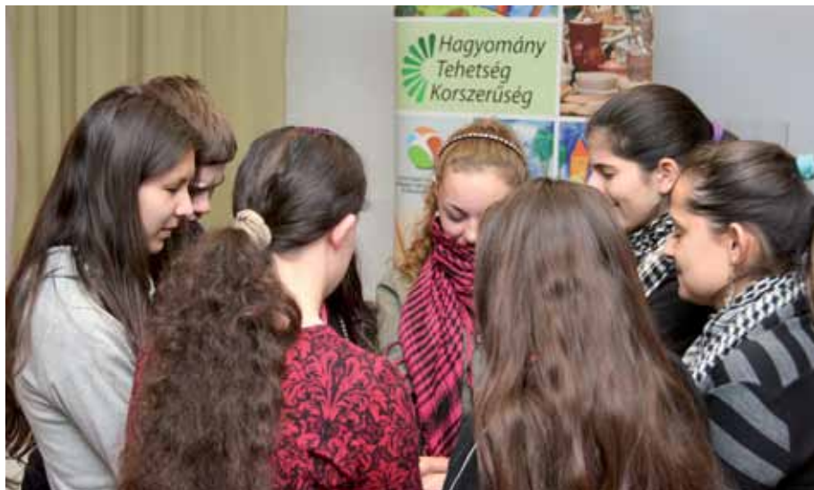
Az életvezetési program résztvevői játékos sgeítségével ismerhették fel az együttműködés fontosságát