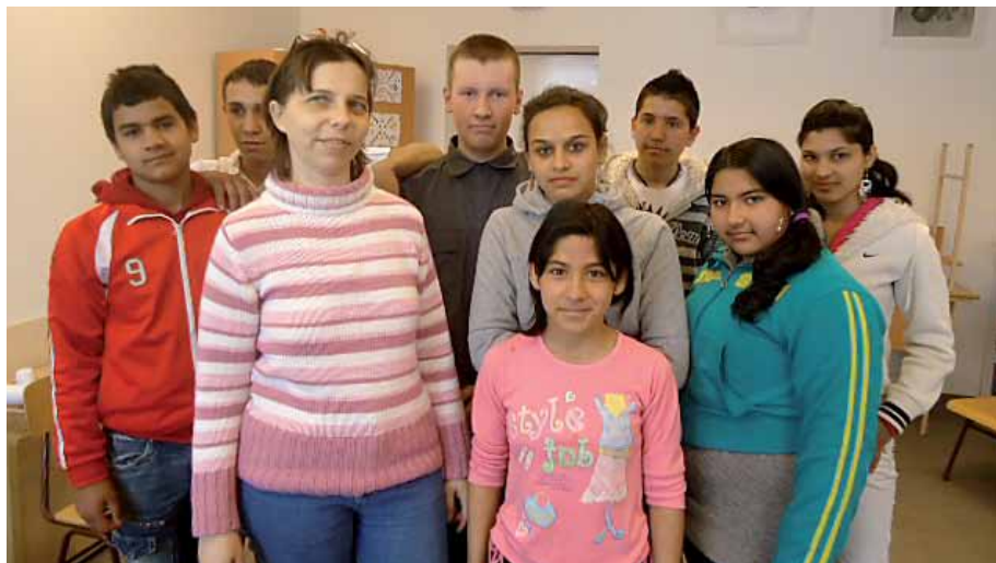
Életvezetési program, Szendrőlád

Az életvezetési programok elsősorban a 13-14 éves korosztályt célozták meg, akik a tréning keretén belül a beilleszkedés problémájával és azok megoldásával foglalkoztak. Fontos helyet foglalt el a tematikába az életvezetéssel kapcsolatos kérdéskörök megbeszélése is. A foglalkozások során igyekeztek a résztvevőkkel a domináns kultúra életvezetési normáit megismertetni, és ezek figyelembe vételével alternatív életpálya modelleket és jövőképeket felvázolni. A résztvevő diákok várhatóan könnyebben élik majd meg a jövőben felmerülő problémákat, jobban tudják kezelni esetleges konfliktusaikat, példáulértékűen viselkednek az adott csoportjaikban. A tanfolyamok, képzések, tréningek oldott légkörben zajlottak, köszönhető ez a színvonalas ellátásnak is. A résztvevők rendszeresen eljártak a foglalkozásokra, bátran fordultak kérdéseikkel a mentorokhoz, trénerekhez. Összegzésképpen tehát elmondható, hogy a fent említett tevékenységek és programok megvalósulása eredményeképp talán elvárható, hogy az adott településeken megerősödik a lokális identitás, illetve előtérbe kerül a helyi hagyományok megismerésére, újraélesztésére irányuló törekvések, amelyek segítségével kezelhetőbbé válnak a beilleszkedési problémák. Ezen kívül nagyon fontos, hogy a tevékenységek által hasznosítható ismeretekhez, speciális tudásfajtákhoz jutottak a képzésben résztvevők és bizonyos mértékig a környezetüket alkotó közösség is.