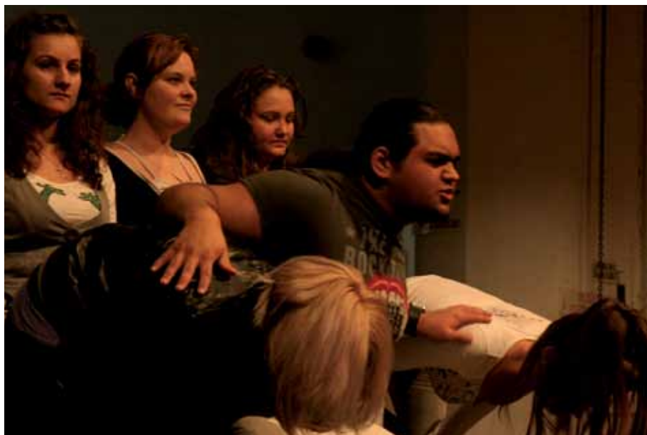
ÓMI Zenés Színház próbája

A megfelelően kiválasztott jelenetek kiemelt jelentőséggel bírtak a párok összehangolt mozgásának kialakításában. A