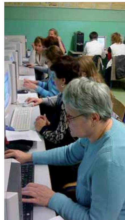
A lelkes putnoki csoport

A szerződések megkötése, illetve a tematika kialakítása az E-tanácsadók által már októberben megkezdődött. A tematika kialakításánál elsődleges szempontként merült fel az E-tanácsadó képzés tematikájának követése, amelyet minden esetben a kutatásban megállapított specifikus elemekkel is ki kellett egészíteni, vagyis