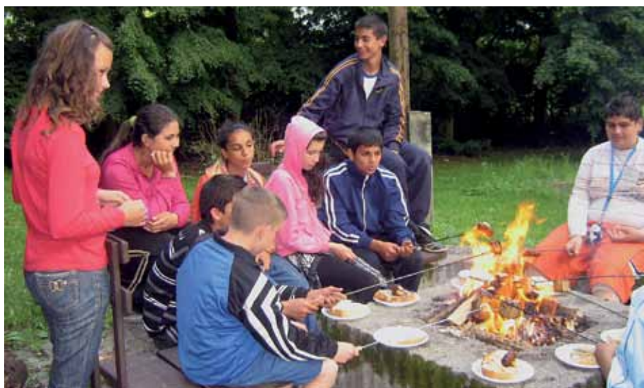
A nem formális tanulás mellett a közösségi tevékenységek is helyett kaptak a táborok programjában