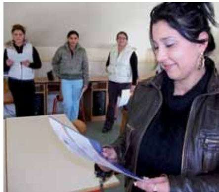
Igazolások átadása Szalonnán

méltó továbbá, hogy a csoport tagjai az oklevél átadásakor kivétel nélkül elégedettségüket fejezték ki mind az oktató munka színvonalát, mind pedig a képzés tartalmát illetően. Több ízben megfogalmazódott ugyanakkor, hogy ha van rá a későbbiekben lehetőség, a tréninget teljesítő hallgatók szívesen csatlakozhatnának hasonló jellegű tanfolyamokhoz, ahol gyakorlatorientált, azaz praktikust tudásterületek elsajátítására van lehetőségük.