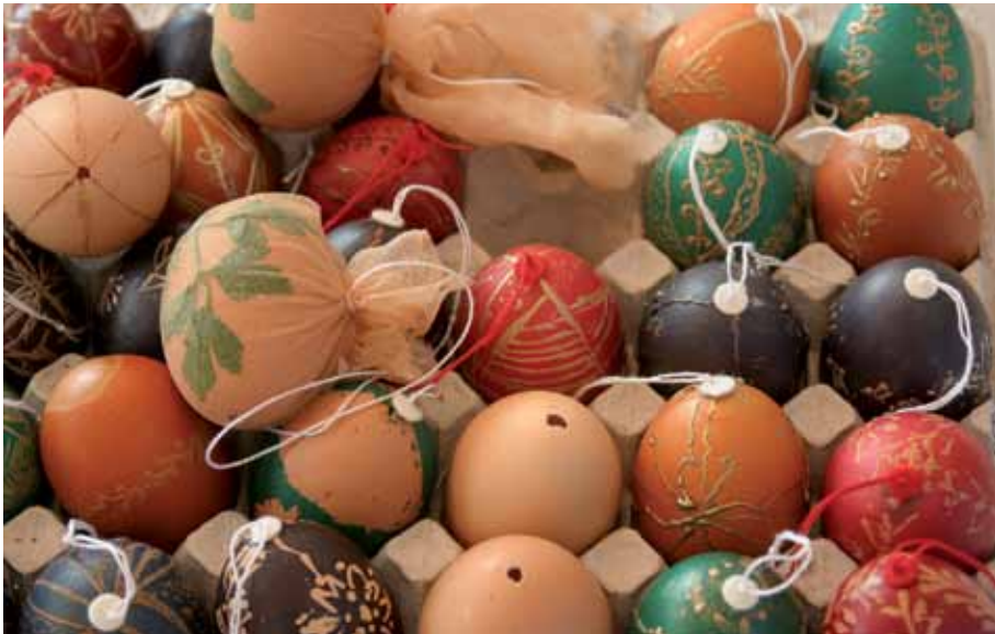
A képzés 4. modulja: tojásdíszítés

ismeretek gyakorlati alkalmazására, s így részesévé váljanak az Aranygyűszű Diszítóművészeti Kör mai kor igényeinek is megfelelő értékmentő és értékteremtő munkájának. Négy modulban, egyenként 30 – 30 órában zajlottak a képzések (gyöngyözés, szövés-fonás, hímzés, tojásdíszítés tárgykörben).