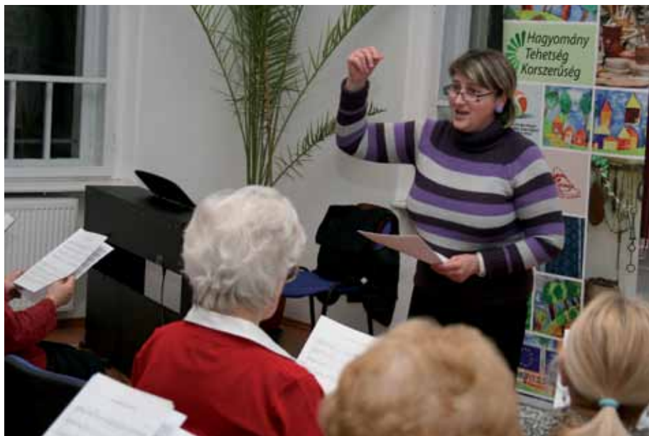
Az Ózdi Városi Vegyeskar hangképzés közben

a hangképzés javítására. A zenei tábor keretében egy hetes intenzív zenei képzésben is részesültek Aggteleken (összesen 25 fő). Az Ózdi Városi Vegyeskar a fenti tevékenységekkel nem formális keretek között kívánta növelni a célcsoport zenei műveltségét, s fejleszteni azon kompetenciáikat, amelyek elengedhetetlenek a nagy múltú előadó-művészeti csoportban való sikeres szerepléshez.