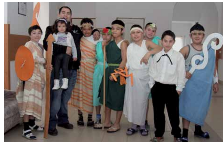
A kulturális seregszemlén fellépő iskolai drámacsoport

A 19. századtól a cigányok ősei közül a régóta egy helyben élők leginkább muzsikálással, kovácmesterséggel, pástorkodással, vályog és téglaegetéssel foglalkoztak, de voltak közöttük a kézműves iparban dolgozó (cipészek, csizmadiák, kosárkötő és kötélfonó) munkások is, sokan azonban földnélküli napszámosként keresték kenyerüket. A cigány asszonyok nagy része ebben az időszakban többnyire a parasztokhoz járt tapasztani, meszelni, kemencét rakni, kendert törni, fonni. A cigányok letelepedett csoportjain kívül azonban nagy tömegekben életek ekkor még az ország területén vándoréletmódot folytató