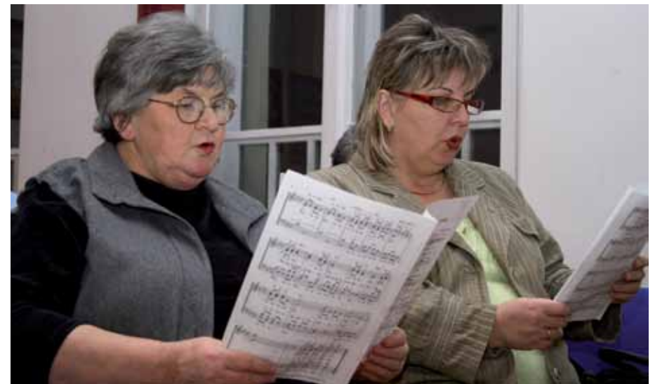
Az Ózdi Városi Vegyeskat tagjai intenzív hangképzésen vettek részt