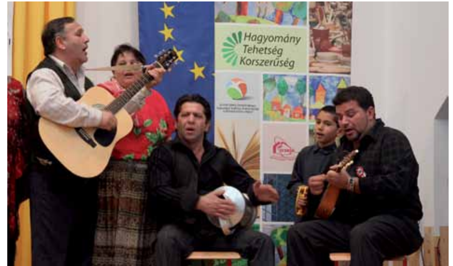
Tehetséges cigány fiatalok kulturális seregszemléjén mindenki lehetőséget kapott arra, hogy tudását bemutassa