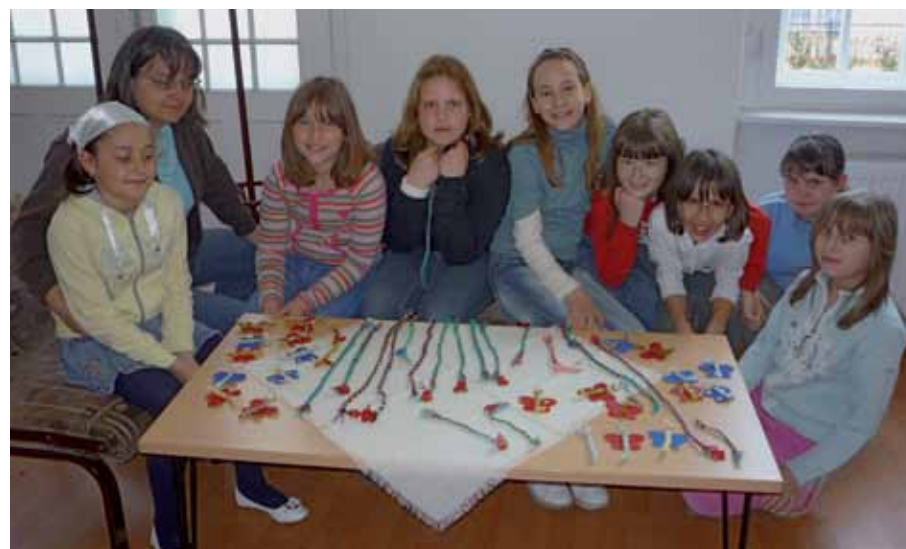
Az Aranygyűszű Díszítőművészeti Szakkör utánpótlása